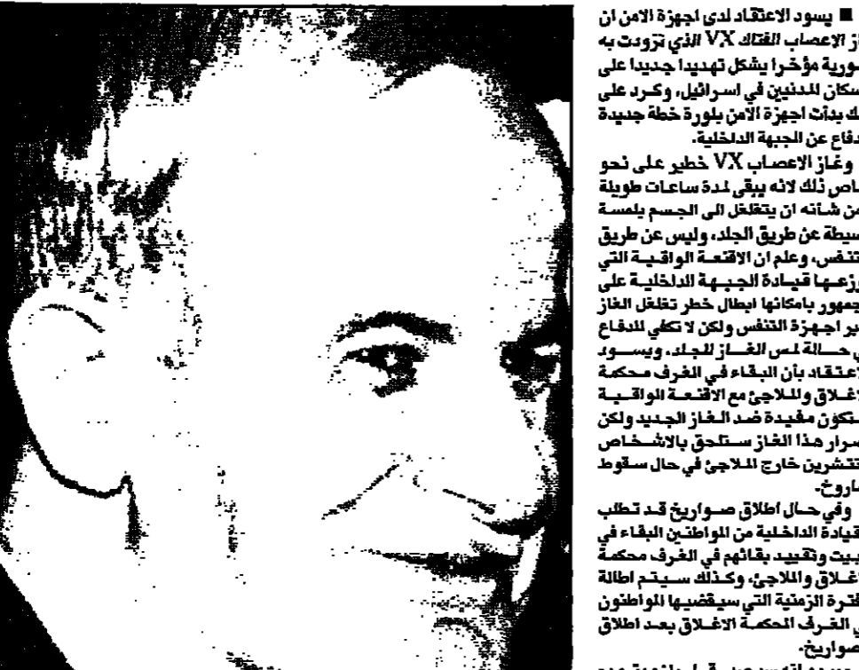
في باخوز (مارتس) 1997/4/30

يبدو انه يسير قرار يلزم بتزيم للاجئ العمارة وتركيب مخيمات هواء فيها، بحيث تتاح للجال لبقاء اطول في للاجئ حتى بدون اقامة واقية، وسيتم تزويد الجيش الاسرائيلي باجهزة واقية بما في ذلك لباس يقي الجلد من الاصابة بغاز الاعصاب.